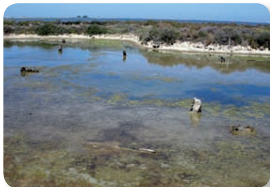
Se llama Saco de la Bahía a la extensión ocupada por aguas pocas profundas que constituyen las planicies mareales, praderas submarinas donde plantas especializadas procuran refugio y alimento a aves y peces. Incluye los bordes de fango y limo de San Fernando, Puerto Real y la isla del Trocadero.

Una vez atravesada la cancela, seguiremos por el carril que discurre paralelo al mal llamado río Arillo [2], hoy reducido a un caño de marisma que nos adentra en la bahía hasta llegar a un observatorio, desde el que no será difícil descubrir correlimos, chorlitos, archibebes, agujas u ostreros.