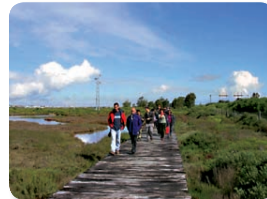
El Parque Metropolitano Marisma de Los Toruños y Pinar de La Algaida forma parte del Parque Natural Bahía de Cádiz. Dispone de una cuidada oferta de uso público (senderos, miradores, actividades deportivas y educativas, etc.) pensada para el uso y disfrute de las poblaciones vecinas.

De vuelta al cruce anterior, seguimos hacia al norte hasta el final del pinar y encontrarnos con un paisaje distinto: las marismas. Un panel explicativo sobre las mismas [4] antecede a una pasarela que nos acerca al borde del parque con la autovía (CA-32), dique que contiene la subida de alguno de los caños que alimentaban a las Salinas Los Desamparados [5].