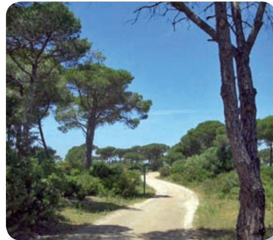
El pinar es uno de los hábitats preferidos por el maestro del camuflaje: el camaleón, especie catalogada como vulnerable por el alto riesgo de extinción al que está sometido.

El sendero es realmente un carril por el que no está permitido el tránsito de vehículos siendo una ruta perfecta para realizar en bicicleta de montaña. Tras rebasar los límites del campus universitario, un panel nos informará sobre las lagunas temporales [2], encharcamientos de suelos de arcillas impermeables, en época de lluvia.